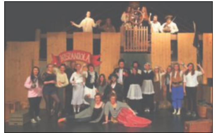
SEIL SKUTA: Scenen er gjort om til en skute, og seiler mot sjørøverøya i jakten på skatter. Og bak de 24 skuespillerne på scenen, står like mange frivillige bak scenen.